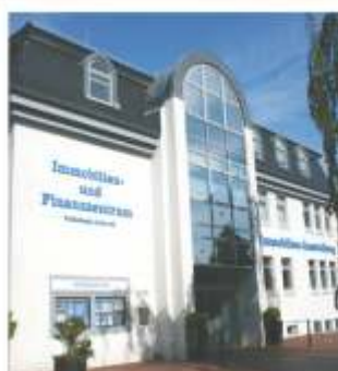
Jever Mühlenstr. 31 - 35