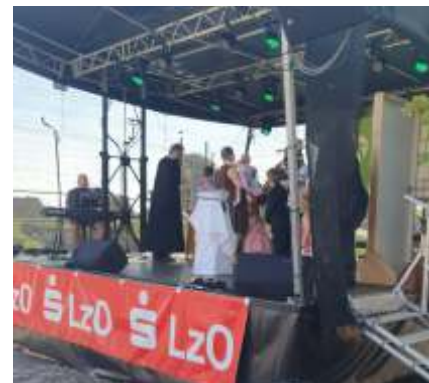
Pfingstgottesdienst 2022 mit Taufe