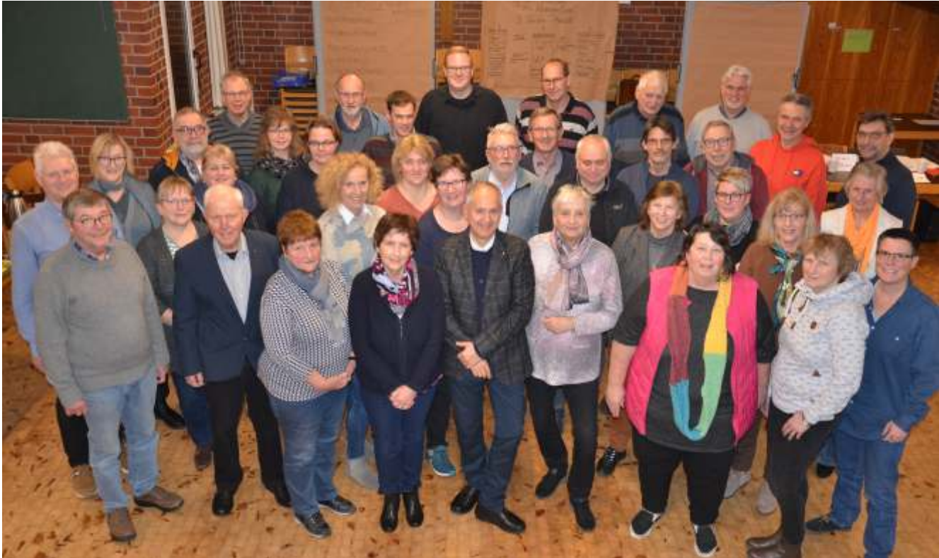
Der Gemeindekirchenrat der neu gegründeten Kirchengemeinde Wangerland hat sich konstituiert. Ihm gehören alle Kirchenältesten der Altgemeinden an.

Am 9. Januar traf sich das erste Mal der Gemeindekirchenrat der neu gegründeten Evangelischen Kirchengemeinde Wangerland. 48 Kirchenälteste und 4 Personen im Pfarramt. „Wird das klappen?“ „Ist mit so vielen Austausch und Meinungsbildung möglich?“ Selbst wenn nicht alle den Termin wahrnehmen können, ist die Gruppe tat-