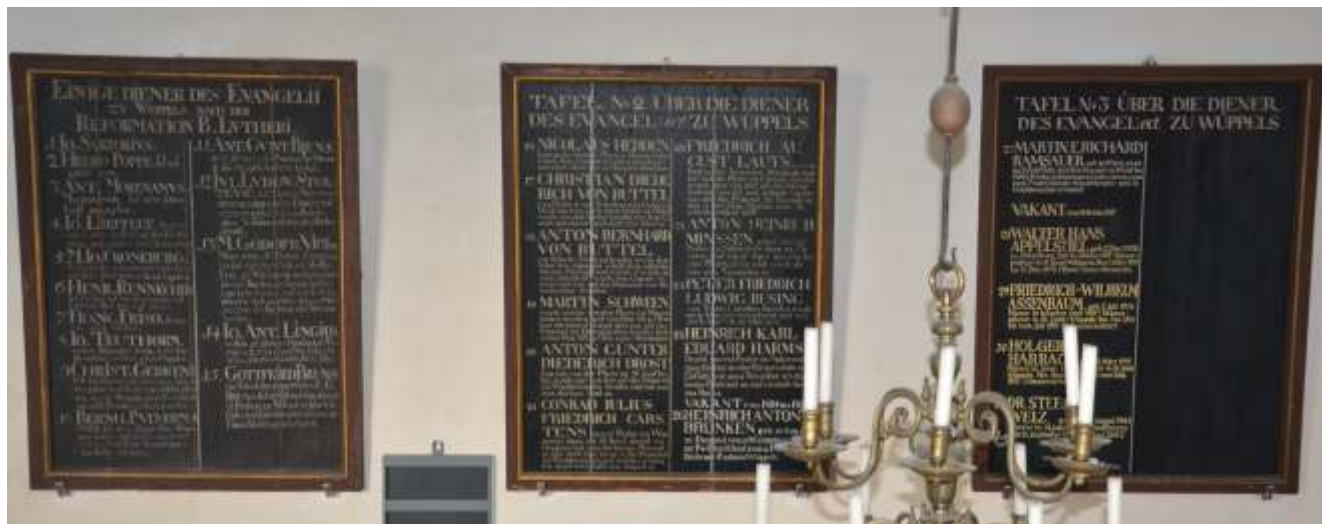
Die Pastorentafeln listen Prediger und Pfarrer der Kirchengemeinde Wüppels (ab 1909 St. Joost-Wüppels) seit der Reformation auf.