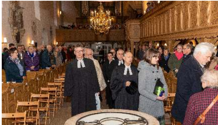
Pastorinnen, Pastoren und Kirchenratsmitglieder beim Einzug in die Sixtus- und Sinicius-Kirche.